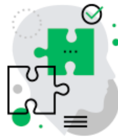
PLANEJAMENTO DE AÇÕES