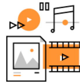
SELEÇÃO DE PROJETOS